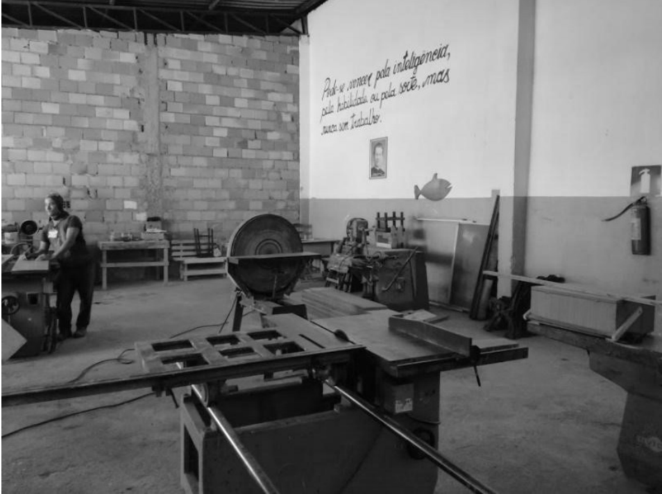
Figura 4 - Laboratorio nel regime semiaperto. Fonte: archivio della ricerca.

Il lavoro in regime aperto , dove le persone escono per lavorare e rientrano per dormire nelle unità, deve concentrarsi su una professione definita, compatibile con l'offerta disponibile e con la specializzazione del recuperando , che deve aver dimostrato merito e piene capacità di tornare alla convivenza sociale. Prima di riconoscere tale beneficio ai recuperandos , il metodo APAC prevede una preparazione rigorosa 30 , indispensabile per non deludere le famiglie che accolgono al ritorno i recuperandos e proteggere la società dal rischio della commissione di nuovi crimini.