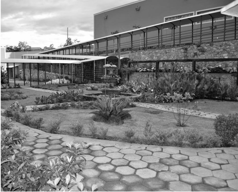
Figura 1 - Cortile APAC di São João del-Rei.

I dodici elementi che compongono il modello APAC sono: (1) la partecipazione della comunità; (2) l'aiuto reciproco tra i recuperandos ; (3) il lavoro; (4) la spiritualità; (5) l'assistenza giuridica; (6) l'assistenza sanitaria; (7) la valorizzazione umana attraverso l'educazione, la professionalizzazione e la terapia della realtà; (8) la famiglia; (9) i volontari; (10) il Centro di Reintegrazione Sociale (CRS); (11) il merito e (12) le Giornate di Liberazione con Cristo, un ritiro spirituale organizzato nelle APACs. Andiamo ad analizzare quei principi che riteniamo più interessanti per ripensare il rapporto tra l'educazione e l'ambiente carcerario.