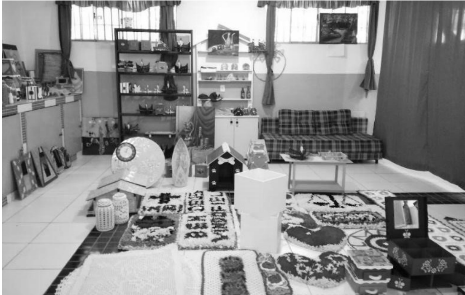
Figura 3 - Prodotti artigianali realizzati nella APAC di Itaúna.

Il terzo principio del metodo è il lavoro: sebbene debba far parte della proposta di reintegrazione – allerta Ottoboni – non deve costituire però l'elemento fondamentale del programma. L'alto tasso di recidiva presente nel mondo si registra anche nei luoghi in cui si mette in atto un ritorno al lavoro, dimostrando che il ricorso esclusivo a questa politica è fallimentare. È, per questo modello, necessario mettere il lavoro al servizio dell'educazione per la reintegrazione sociale, piuttosto che sottomettere il progetto educativo alla mera inserzione lavorativa.