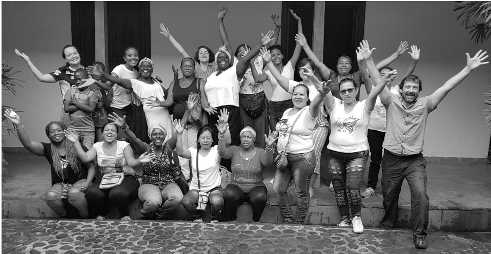
The Mujer Violeta group, the Fine Arts students and the author, during the workshop.

exercise, an ancestor does not necessarily mean a person older than the woman or already dead. An ancestor means a person who inspires the woman by how she is living or lived her life. This technique implies taking some distance from the pure autobiographical story, but also a reconnection with a significant person. In the three ancestor's stories that the group chose to stage, the monologues begin with the ancestor's story, but are told in connection with the role this person had for the witness, in her experience as victim of violence and displacement. The starting point of the narrative was the story of the ancestor, but the point of arrival was always the witness and how the ancestor inspired her on her path of healing in the present.