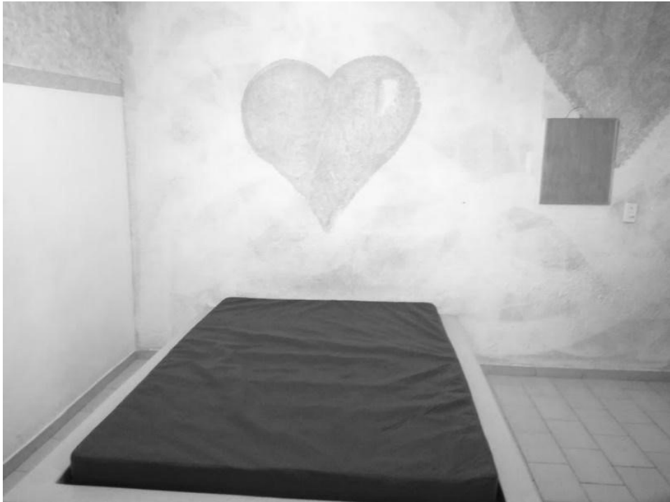
Figura 5 - Stanza delle visite intime nella APAC di Itaúna.

Le visite intime sono usate anche come strumento di controllo e di scambio. È obbligatorio per le coppie che lo richiedono prendere parte a corsi e formazioni, permettendo in questo modo di includere nel progetto educativo anche i familiari che non si trovano in stato di detenzione. Anche i familiari delle vittime ricevono pertanto assistenza da parte delle APACs attraverso un gruppo specifico di volontari. Si vuole qui inoltre incentivare la ricostruzione dei legami tra vittime e infrattori nell'ottica della giustizia riparativa 35 , contribuendo a educare la società attraverso le vittime.