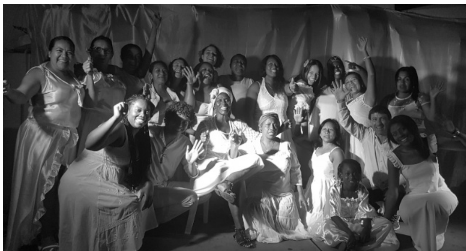
The women of “Mujer Violeta” and the students of the “Arts for Reconciliation” Research Project after the presentation, Cali, December 5, 2018.